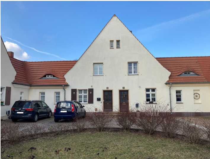
ehem. Arbeiterwohnhaus der Gartenstadt Lauta-Nord