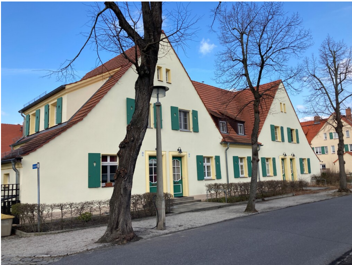
ehem. Arbeiterwohnhaus in der Gartenstadt Lauta-Nord