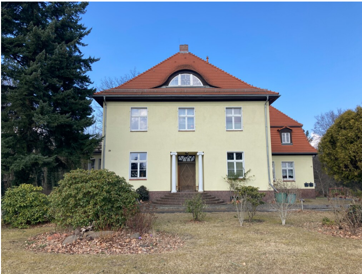
villenartiges Wohnhaus in der Gartenstadt Lauta-Nord