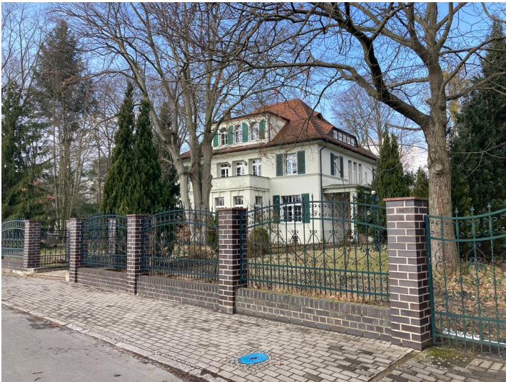
Villa in der Gartenstadt Lauta-Nord