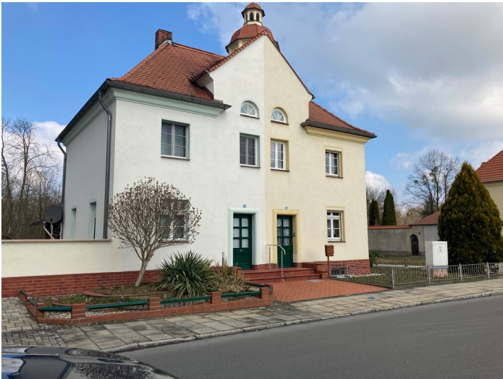
Doppelwohnhaus in der Gartenstadt Lauta-Nord