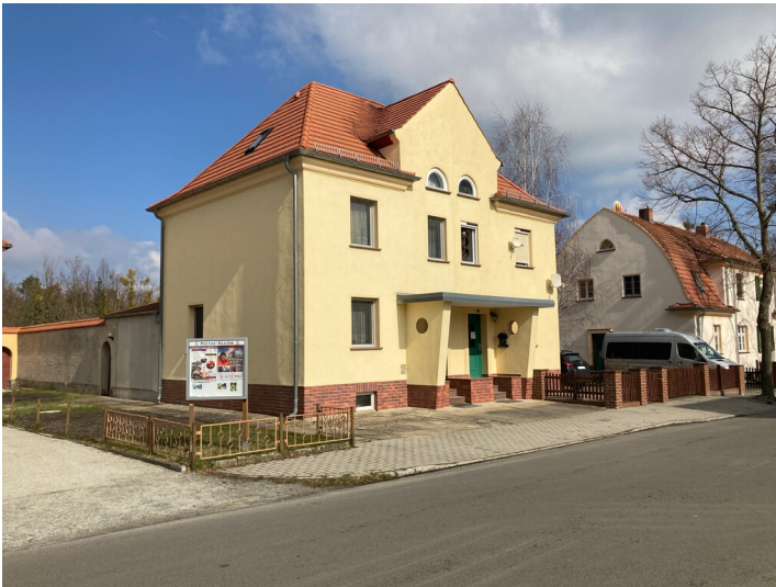
Doppelwohnhaus in der Gartenstadt Lauta-Nord