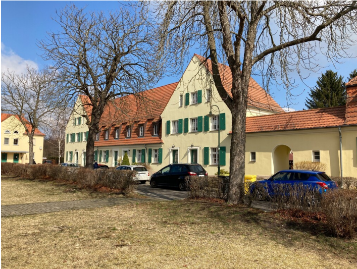
Arbeiterwohnhaus in der Gartenstadt Lauta-Nord