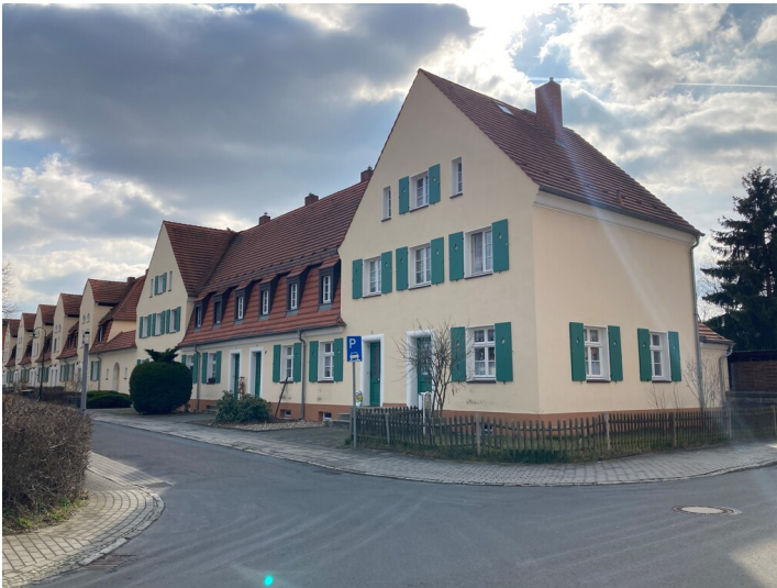
Arbeiterwohnhaus in der Gartenstadt Lauta-Nord