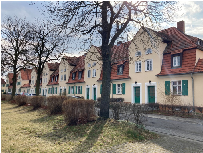
Arbeiterwohnhaus in der Gartenstadt Lauta-Nord