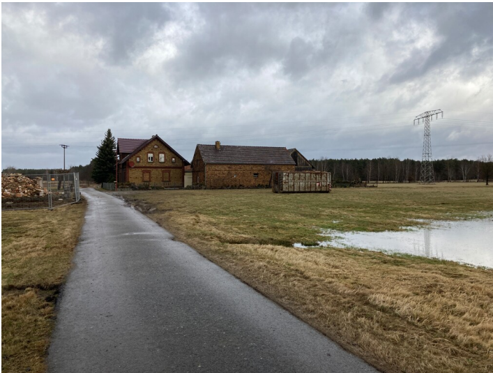
Bauernhaus als Vierseitshof in Mühlrose