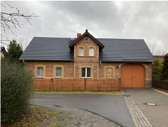
Bauernhaus Mühlrose