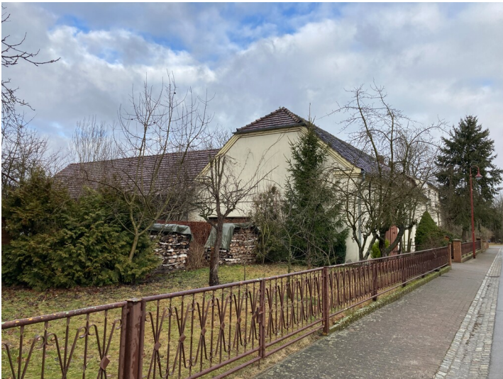
Schrotholzscheune in Mühlrose