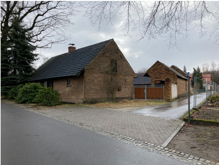
Bauernhaus (mit Schrotholzanteil) in Mühlrose