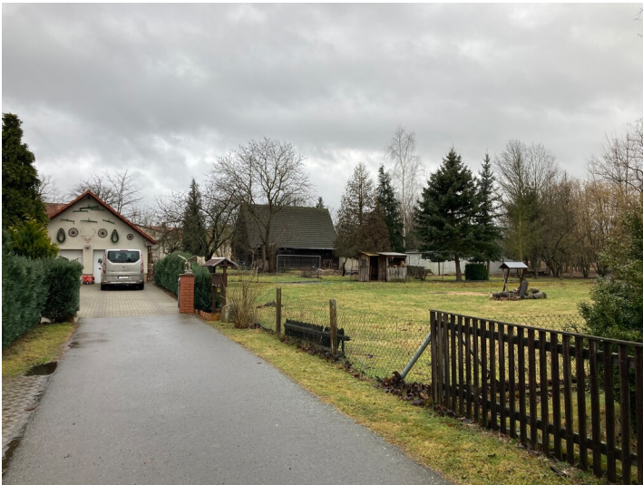
Schrotholzscheune Mühlrose