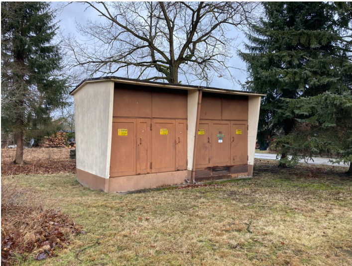
Transformatorenstation Mühlrose