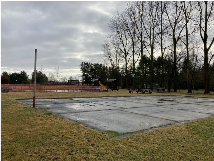
Freibad Mühlrose