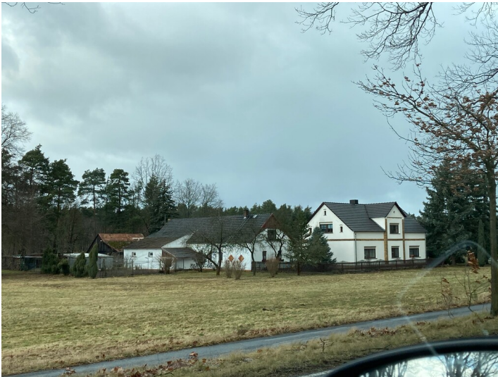
Vierseithof Mühlrose