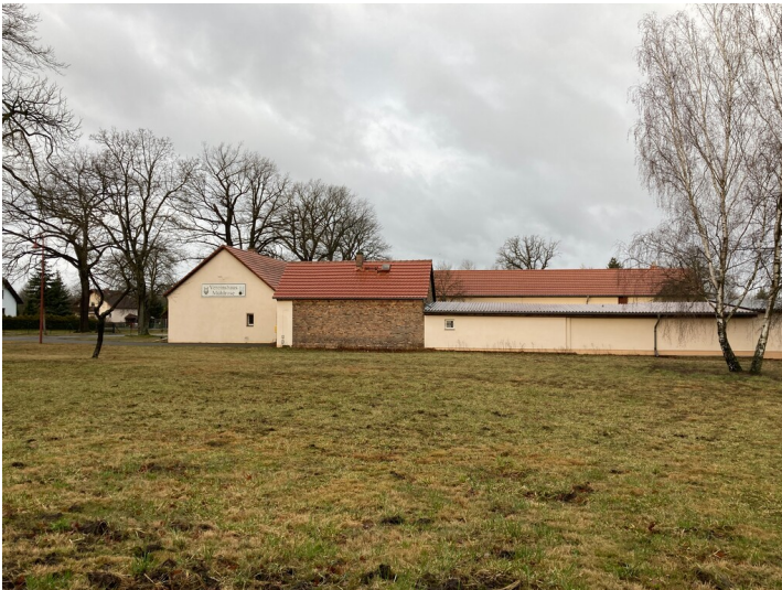
ehem. Vereinshaus, Kindergartenweg 20