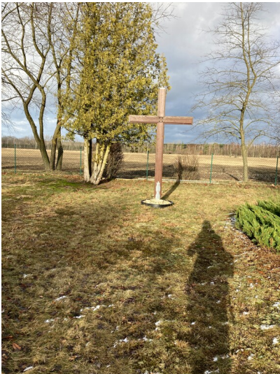
Friedhof Mühlrose