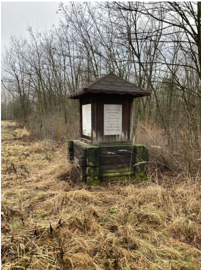
Denkmal Umsiedlung Mühlrose