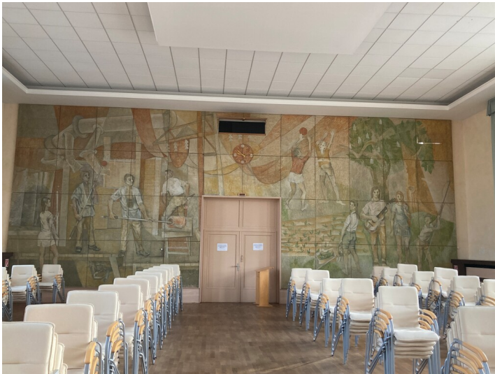
Wandbild im Großen Saal der Telux