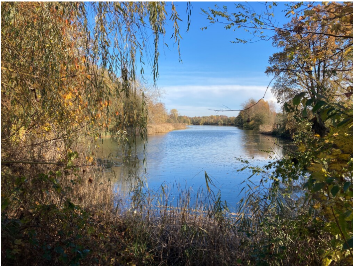
Jahnteich, ehem. Grube Weißwasser