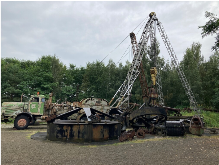
Maschinenpark, Großschachtbohranlage SC 500