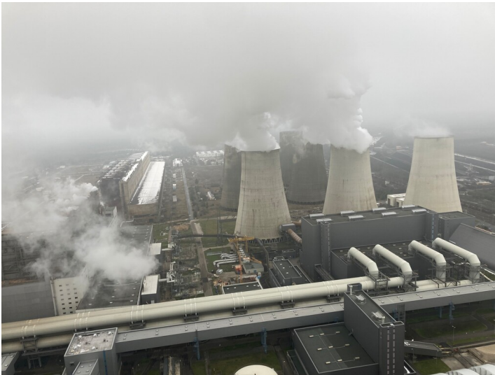
Gipslager am Block Q des Kraftwerks Boxberg, Ansicht von Osten