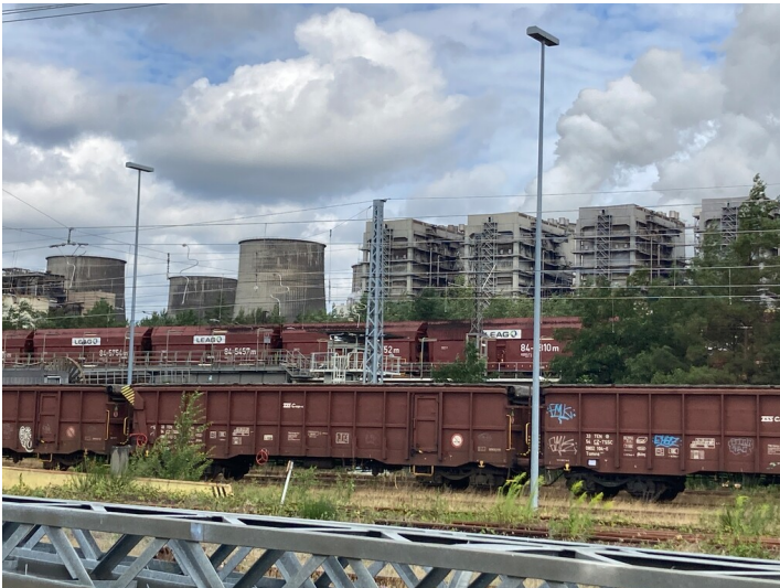
Übergabestation 6 des Kraftwerks Boxberg, Ansicht von Süden