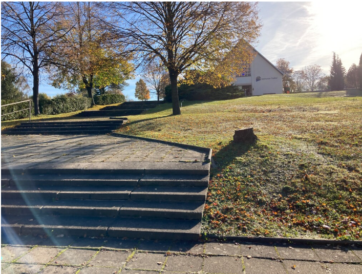
Friedhof Olbersdorf