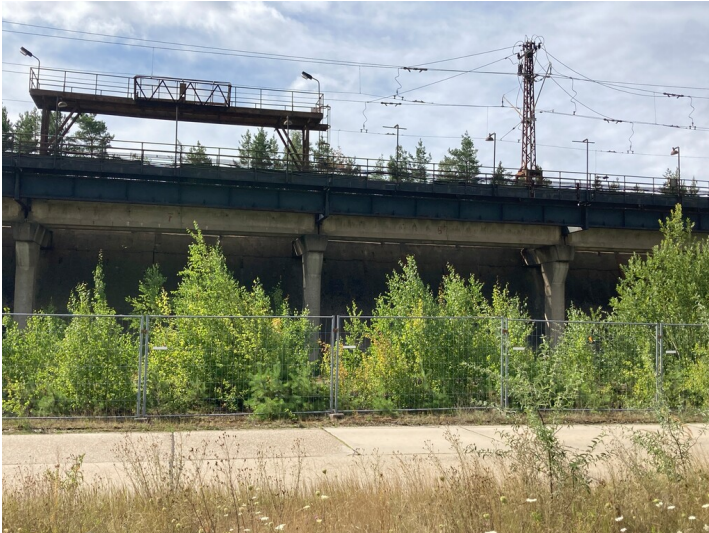
Übergabestation am Altwerk Kraftwerk Boxberg