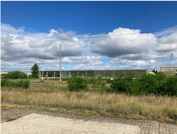
Heizöllager am Altwerk Kraftwerk Boxberg, Ansicht von Süden