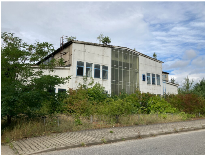
Ehemalige chemische Wasserreinigungsanlage am Altwerk Kraftwerk Boxberg, Ansicht von Osten