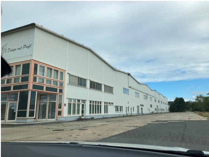
Halle VII am Altwerk des Kraftwerks Boxberg, Ansicht von Südosten