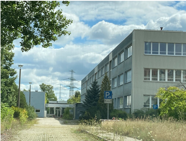
Ehemaliges Berufsschulzentrum und Lehrlingswohnheim des Kraftwerkes Boxberg, Ansicht Berufsschulzentrum von Westen