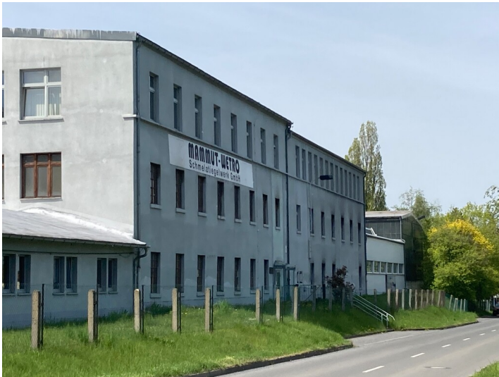
Schmelztiegelwerk Wetro, Ansicht von Nordosten