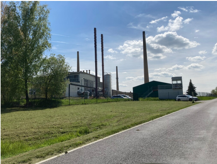
Feuerfestwerke Wetro, Ansicht von Norden