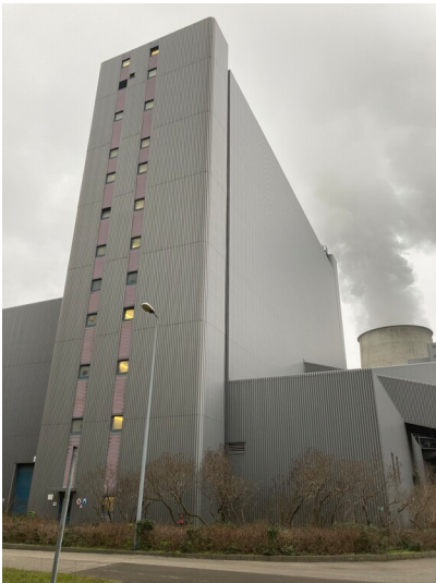
Kalksteinmühle des Kraftwerks Boxberg, Ansicht von Osten