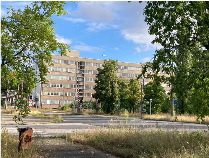
Verwaltung Altwerk des Kraftwerks Boxberg