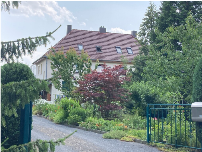
Beamtenwohnhäuser des Braunkohlenwerkes Hirschfelde, Ansicht Am Werk 1