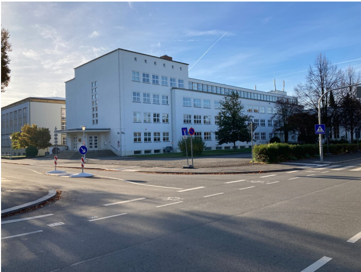
Gewerbeschule Zittau, Ansicht von Nordwesten