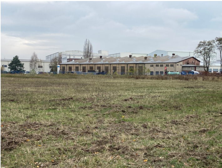
Hauptwerkstatt des Braunkohlewerkes Hirschfelde, Ansicht von Südwesten