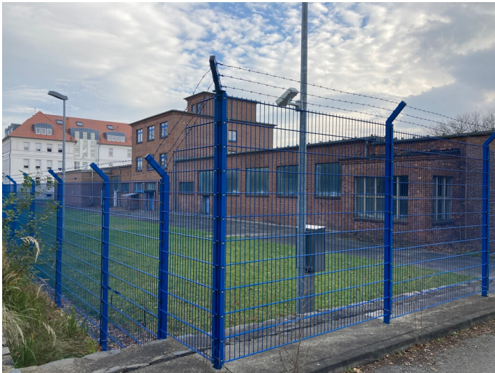
Feuerwehrdepot Braunkohlewerk Hirschfelde, Ansicht von Nordwesten