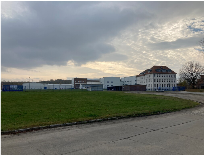
Brikettfabrik B Hirschfelde, Ansicht von Nordwesten