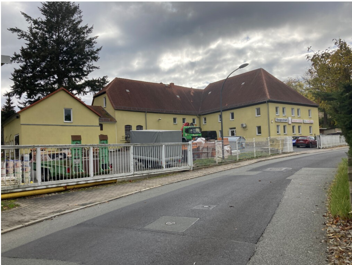
Mistmühle Olbersdorf, Ansicht von Norden