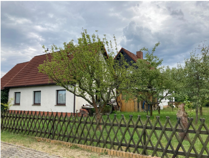
Siedlung Nieder Prauske, Ansicht Wohngebäude Mocholzer Straße