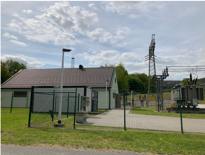
Umspannwerk Rodewitz/Spree, Ansicht von Südosten