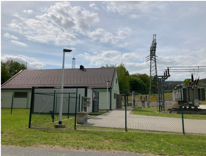
Umspannwerk Rodewitz/Spree, Ansicht von Südosten