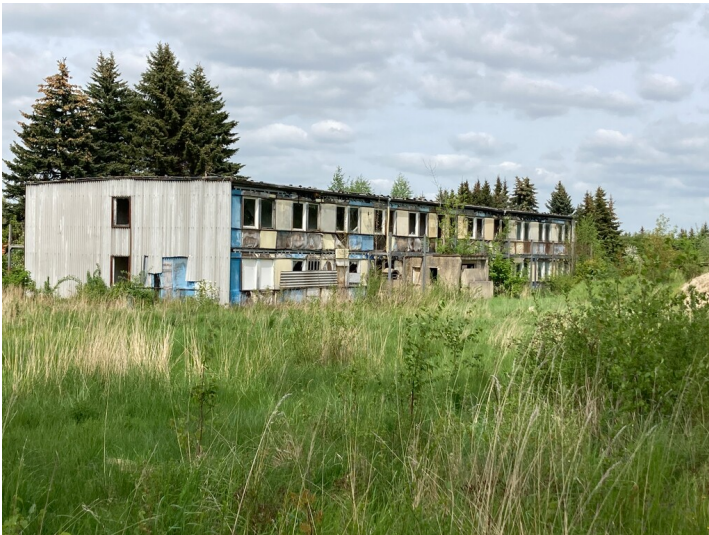
Ehemaliges Ferienheim des Braunkohlenwerkes Berzdorf, Ansicht von Osten