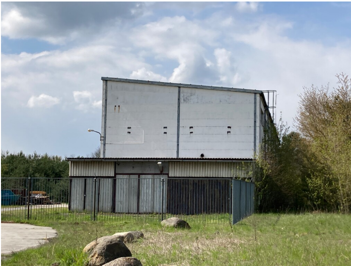
Ehemalige Tagesanlagen Scheibe, Ansicht von Osten