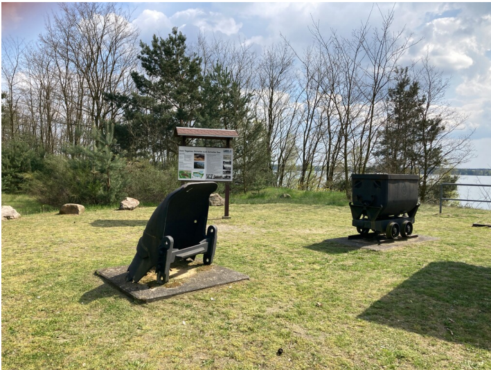
Gedenkstätte für den Tagebau Scheibe