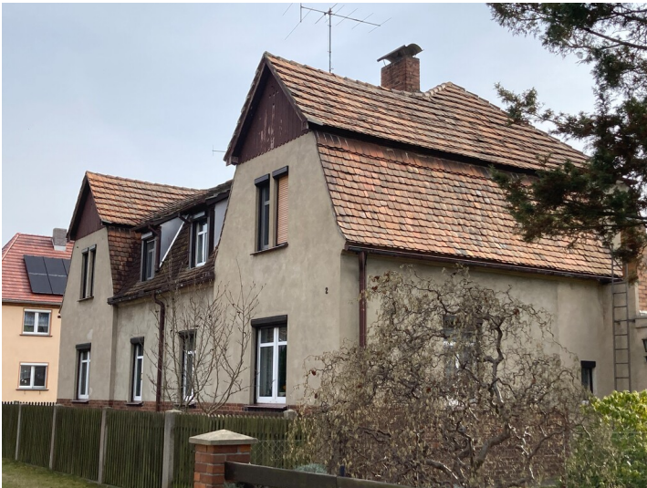
Siedlung der »Bergbaugesellschaft Teicha«, Ansicht Bergstraße 2