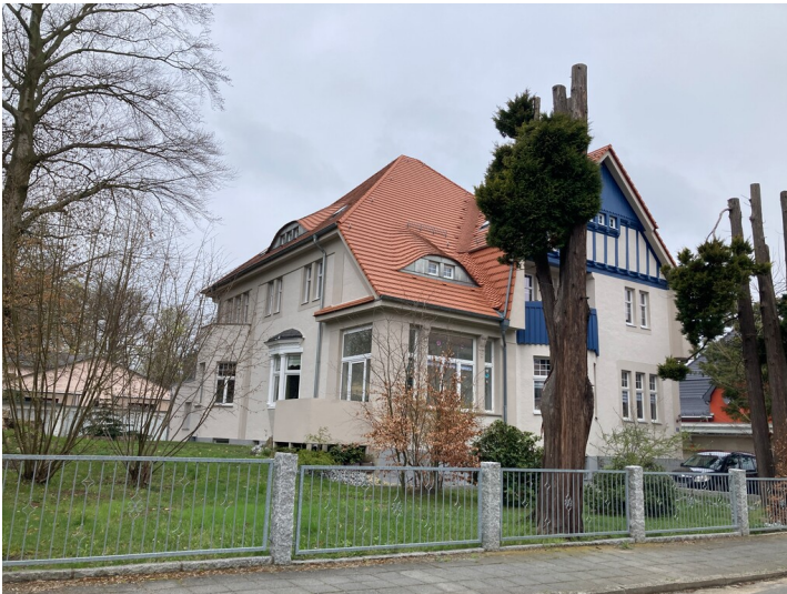
Direktorenvilla Christoph & Unmack AG, Ansicht von Südosten