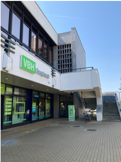
Musikschule Bergbauorchester Hoyerswerda, Ansicht von Norden