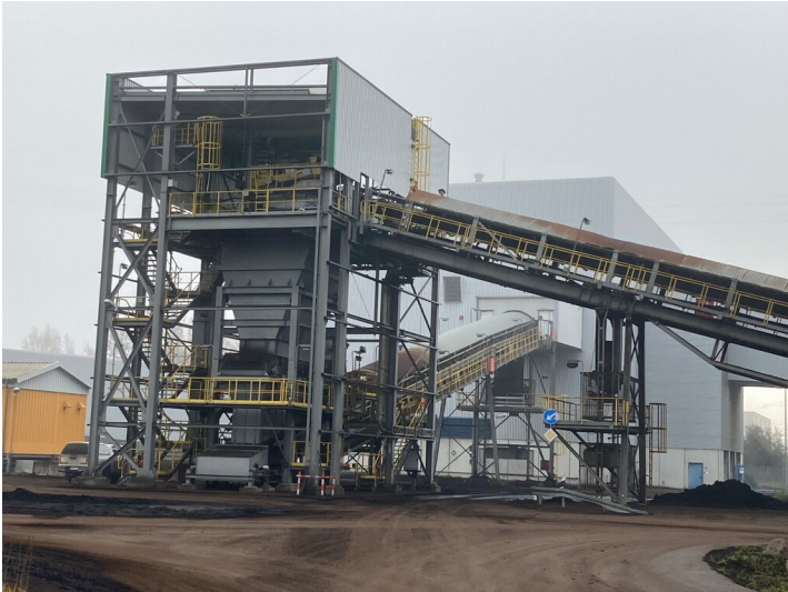
Kohleverladung des Tagebaus Nochten